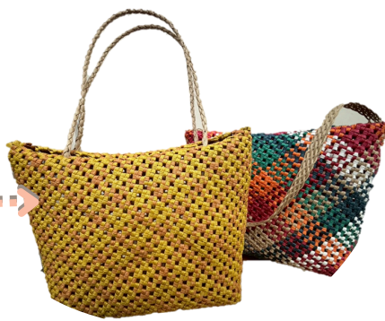
四つ畳編みで編んでいく