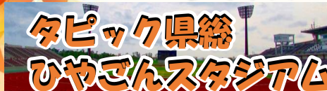
タピック県総ひやごんスタジアム