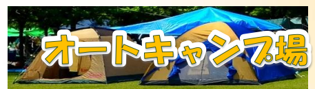
アウトキャンプ場