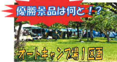
オートキャンプ場1区画

※メール・FAXでのお申し込みをされる方は必ず申込用紙が届いているかの確認をお願い致します