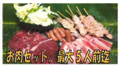
お肉セット、最大5人前迄

☆優勝チームには1人1人にキャンプ場1区画(1泊2日)分とお肉セットが一緒にご利用できるチケットを配布!